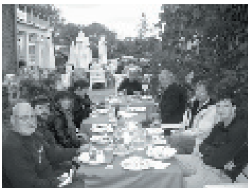
Mannskapet slapper av på Brøndums.