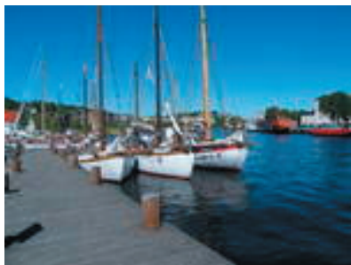
Risør II ved Isegran i 2009

Risør II tar i år igjen turen til Isegran ved Fredrikstad i pinsa. Turen er fulltegnet og vi gleder oss til seilasen over til Fredrikstad(via Stavern), regattaen 1.pinsedag og ikke minst å treffe alle trebåtentusiastene. Vi satser på godt sommervær og passelig med vind. Rapport fra turen kommer på hjemmesida og kanskje i neste nr. av Risør II-nytt.