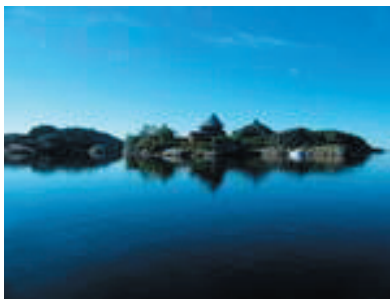
Stemning ved Stavern fra turen i 2009