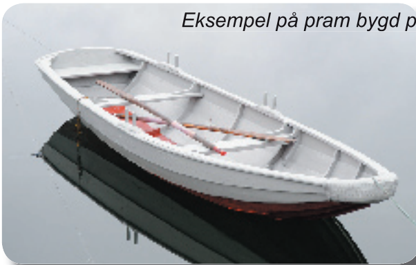
Eksempel på pram bygd på Hammeråker

Våren det året jeg begynte på skolen, slapp prammen og jeg taket i brygga, og 10 fine år, med mange nye spennende, farlige, og morsomme historier begynte. I min og mine kameraters fantasi fikk prammen et utall av oppgaver å dekke. Den måtte tjene som rekestråler, fraktejakt, speedbåt, hvalfanger, brønnbåt, mudderpram, ja og ikke minst seilbåt. Men disse historiene kan vi komme tilbake til ved en senere anledning.