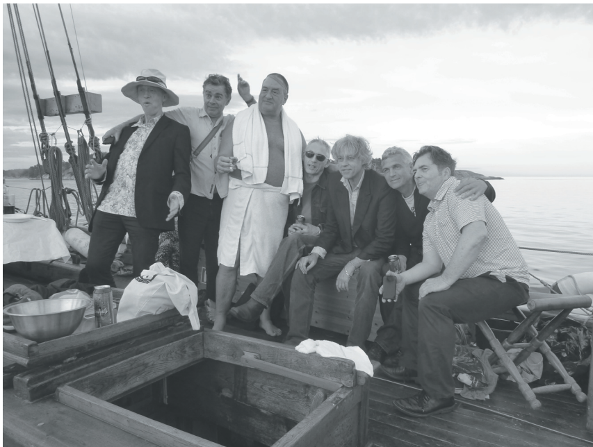
Sir Bob Geldhof med følge ombord i Risør II

Risør II lå strategisk plassert hele uka, og flere av medlemmene benyttet seg av "hotellbåten" både til hverdag og fest, og de fleste fikk med seg flere flotte konserter.