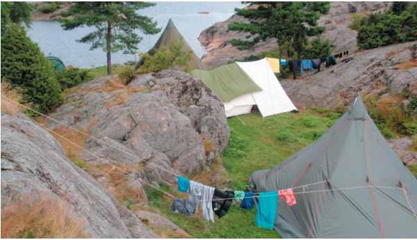
Teltleir på Bukkholmene.

Jentene er samstemte i at de har lyst til å dra på tur med Risør 2 neste år også. Det var kjempegøy!! Det eneste de ønsker mer av til neste år er mer vind i seila!!